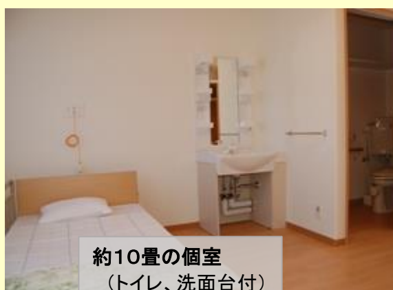
約10畳の個室 (トイレ、洗面台付)