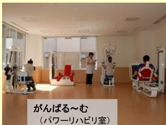
がんばる〜む (パワーリハビリ室)