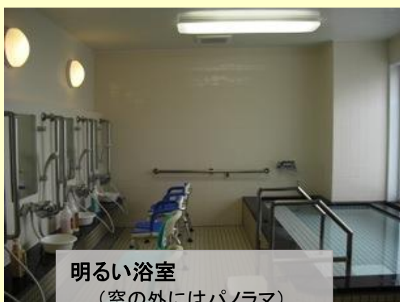
明るい浴室 (窓の外にはパノラマ)