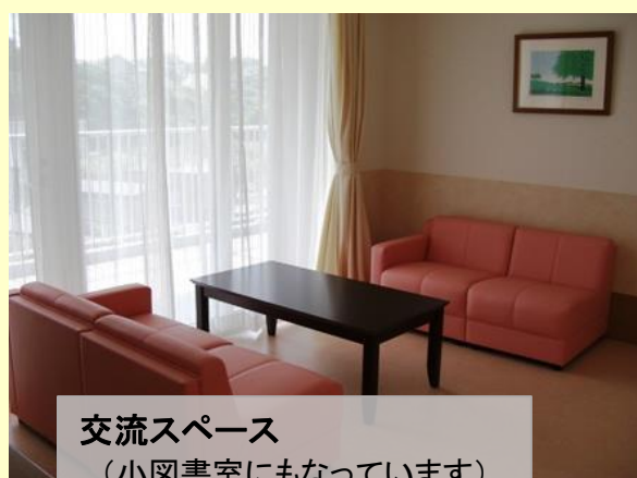
交流スペース (小図書室にもなっています)