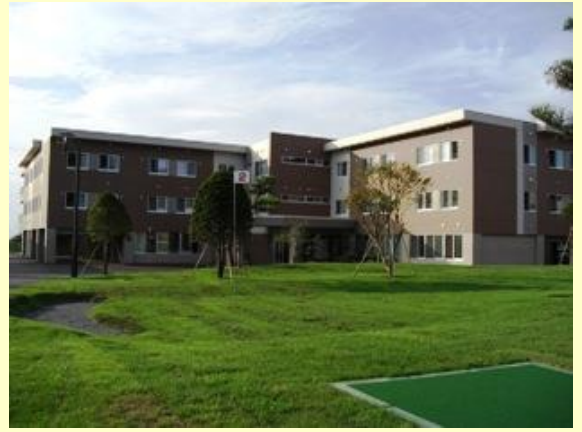
ミニ・パークゴルフ場